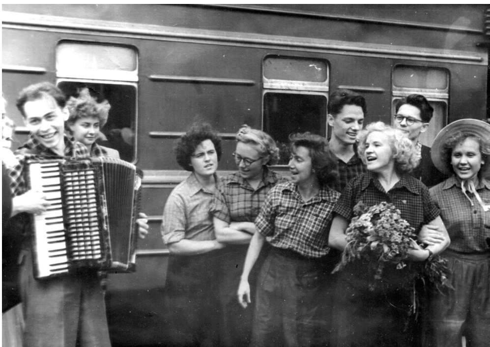
Агитбригада Биофака МГУ отправляется в Алтайский агитпоход