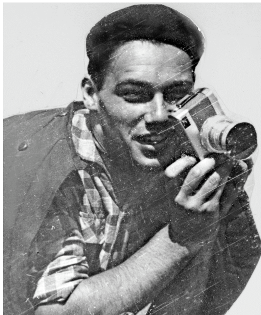
Володя Познер – выпускник Биофака МГУ, ныне известный телеведущий