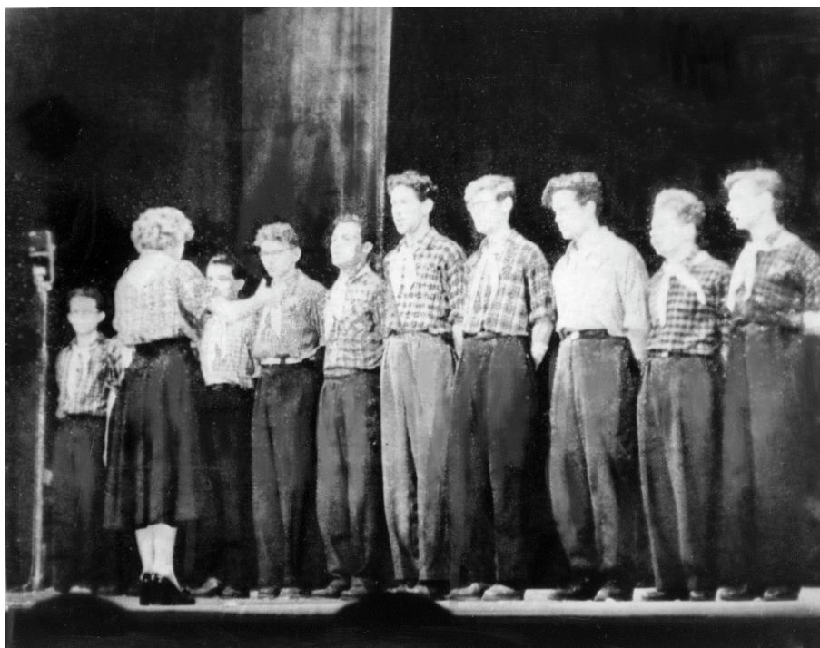
Выступление мужского ансамбля Биофака МГУ

комсомольских собраниях, в перерывах между лекциями, в поезде или машине по дороге на практику, у костров на практике – все пели. На факультете был свой Гимн, сочиненный студентами на практике в 1949 году на музыку Исаака Дунаевского из кинофильма «Весна», которым мы, стоя, открывали комсомольские собрания и смотры художественной самодеятельности. Пели песни советских ком-