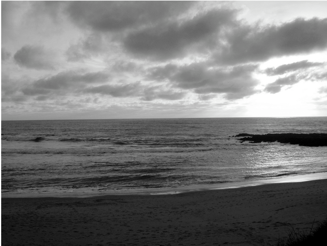
Закат на Тихом океане. США

«Не погибнет Россия, если у нее есть такие сыны, как Николай Иванович Вавилов!» Так сказал выдающийся рус-