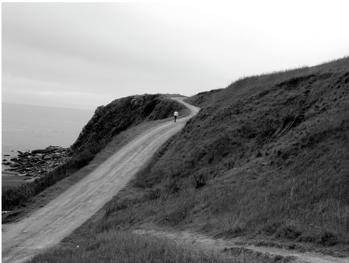
На побережье Тихого океана. США

В 1986 году наш курс вновь отмечал, на сей раз 30-ю, годовщину окончания Биофака. Сначала было торжественное собрание в аудитории, потом пошли пировать в 10-ю столовую – традиционное место банкетов нашего факультета. В это время почти все мои однокурсники были живы и здоровы.