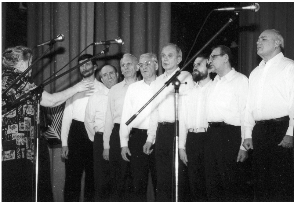
Поет мужской ансамбль Биофака МГУ. 2002 год