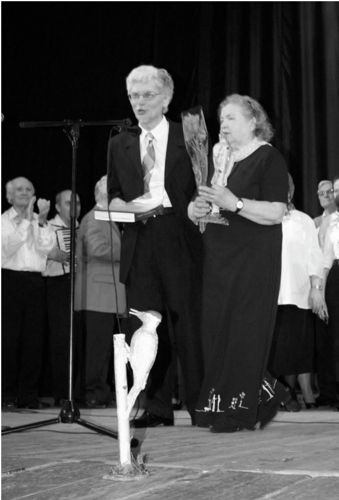
Вечер, посвященный презентации книги «Ты в сердце моём, Биофак»