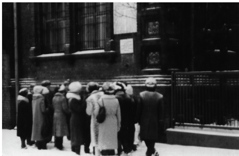
Экскурсия по местам боевой славы. У здания французской военной миссии

Конечно, запомнился веселый и трогательный праздник, устроенный кафедрой на мое пятидесятилетие. Было обильное застолье, много сказано теплых, хвалебных слов в мой адрес сотрудниками и студентами.