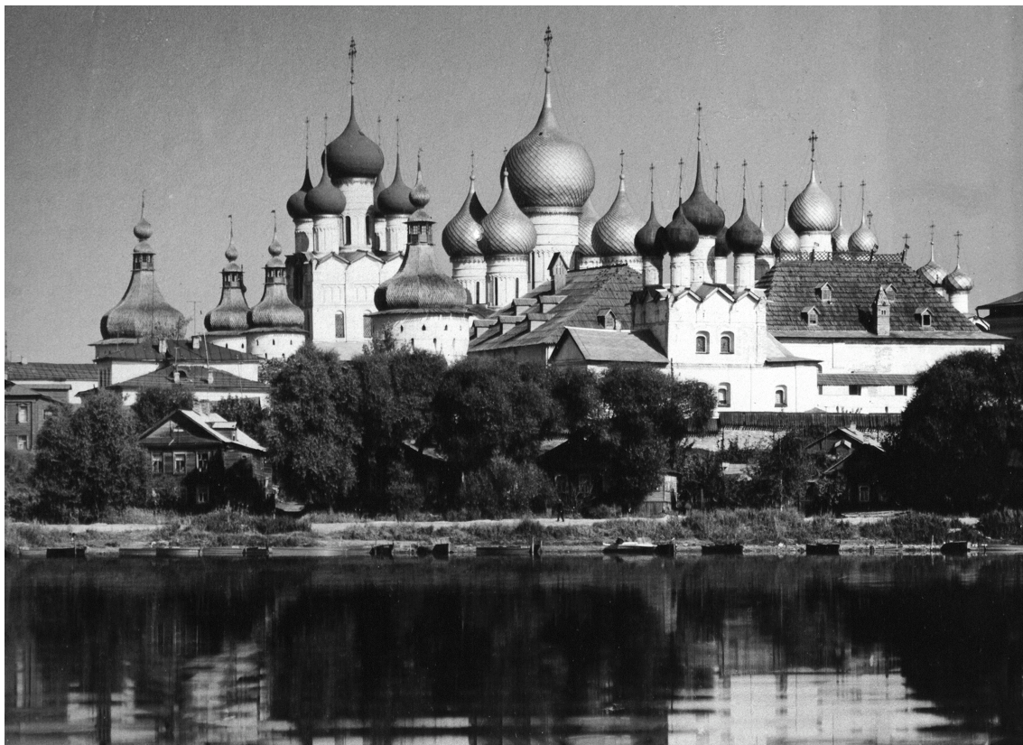
Ростов Великий – родина моей мамы

Этот мамин поступок говорит о её бесстрашном, решительном характере – шел 1938 год.