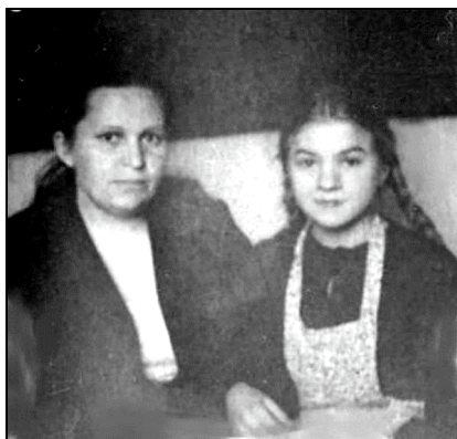
Моя мама и я. Послевоенные годы

Все, кто знал маму, всегда отмечали её гостеприимство, её удивительное умение готовить. Конечно, все праздники – 7 ноября, новый год, 8 марта, 1 мая, день Победы и дни рождения – сопровождались обильным и вкусным застольем. Во время войны и некоторое время после её окончания продукты выдавались по карточкам, притом только самые необходимые – сахар, соль, мука, крупа, (в войну ещё по лендлизу